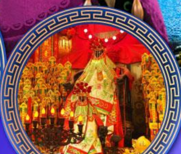
เจ้าแม่กวนอิมฮ่องกง